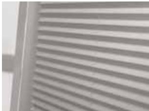
Plissé & Duette®