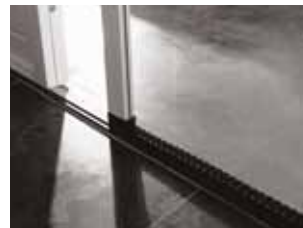
Raam- en Deurhorren