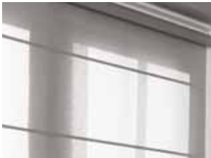
Washi & Roll-up Blinds