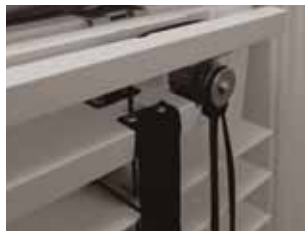
Houten & Lederen Jaloetzeën